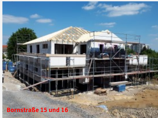
Bornstraße 15 und 16