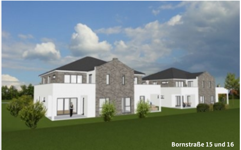
Bornstraße 15 und 16

Unser zweites Bauvorhaben befindet sich in Barsinghausen in der Bornstraße 15 und 16. Auf diesem Grundstück entstehen aktuell zwei 4-Familienhäuser mit einer Wohnfläche von ca. 85 – 97 m 2 pro Einheit. Beide Objekte sind ohne Fahrstuhl geplant. Die Vermietungsaktivitäten laufen bereits.